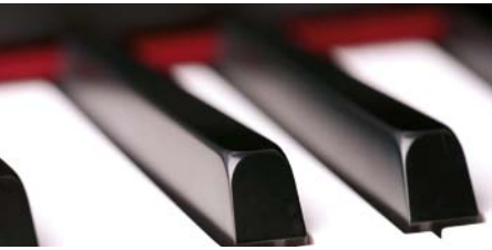
Patented cold drawn spring wire / piano wire