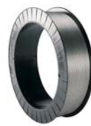
SH 390 / SH 460 Spulen / reels