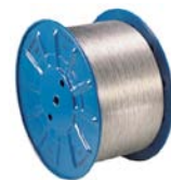
560F / 760F / 760FF Spulen / reels