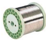
K 125 / K 200 / K 355 Spulen / reels

Abhängig von Produkt und Drahtabmessung bieten wir nachfolgende Lieferformen an: Depending on product and wire size we offer the following packaging: